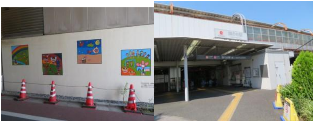
※旗の台駅への路、旗の台駅

③13時44分、大井町線の右側を歩く。荇原町駅には13時54分到着する。暫く歩いた先で大井町線下を潜り、鉄道の左側となる。池上線の旗の台1号踏切を横切る。踏切を渡ると、旗の台駅（14時7分）があった。14時13分、伏見稲荷神社前で本日の安全を祈願する。幹線道路を淡々と歩いた先に北千束駅（14時26分）があった。