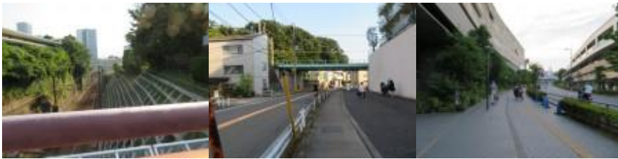
※二子玉川駅への路

⑦駅前の幹線道路を横切り、大井町線の左側を歩く。その先に、16時38分、大東急記念文庫、五島美術館があった。16時40分、大井町線を跨ぎ、鉄道の右側となる。急な坂道を下る。16時45分、大井町線を潜り、鉄道の右側となる。駒沢通りに出る。前方に大井町線が登場。ここで左手に駅らしいのが見えたので誤って左側に進む。ここでも地元の人のお世話になり、リカバリーできる。ビル内にある粋な店が立ち並ぶ道筋を経由し、二子玉川駅には16時59分到着する。二子玉川駅（17時5分発）から大井町線（溝の口駅まで）、田園都市線各停（鷺沼駅まで）、田園都市線急行（長津田駅まで）、そしてこどもの国線を乗り継いで、こどもの国駅に移動する。