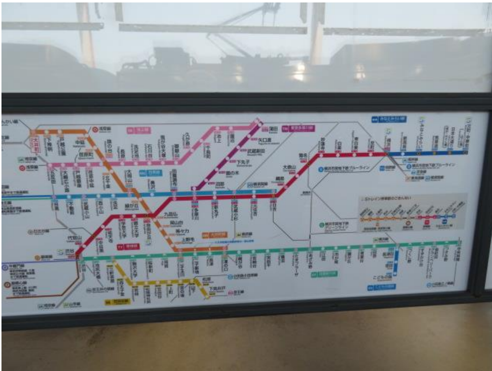
※東急電鉄の路線図

22年前の本日、山手線1周にチャレンジしたのが昨日のように思い出され懐かしい。あれから早くも22年の歳月が流れる。22年の歳月を得て、 1万3千5百km もの記録が誕生するとは。まるで夢をみているようで、自分でも信じられない。しかも、稚内から鹿児島までの”日本縦断の旅”に関し、各駅立ち寄りを樹立した。加えて、”歩き鉄の旅”として日本全国を対象に41編ものPDFを公開させて頂いている。 時間の重みと大切さ を強く感じる今日この頃である。