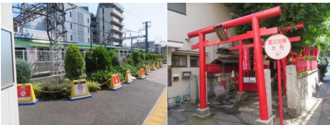
※池上線、伏見稲荷神社