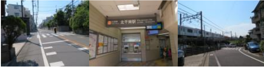
※北千束駅への路、北千束駅

④この駅から大岡山駅の道筋、鉄道に沿った路筋がなく、また大岡山駅界限は鉄道が地下になっていることもあり、迷路に入る。大回りして東急目黒線の洗足駅界限に来ていたらしい。最初に聞いた道筋を勘違いして進行したのが大失敗。一度道に迷うと迷路に入り、現在位置が不明確となり、ややもするとパニック状態になりかける。二人目、三人目の地元の人のお蔭でリカバリーができる。途中、右手に東急目黒線が登場する。その先で大井町線と目黒線が合流する、大岡山駅には14時56分到着。路に迷ったことにより、800mの営業キロに30分も要する。この駅は、3カ月前に訪れたばかりなので、鮮明に記憶に残っていた。本日の一番の難所であった。