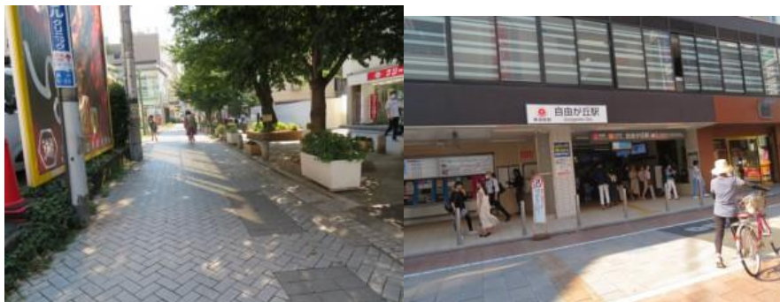
※自由が丘駅への路、自由が丘駅