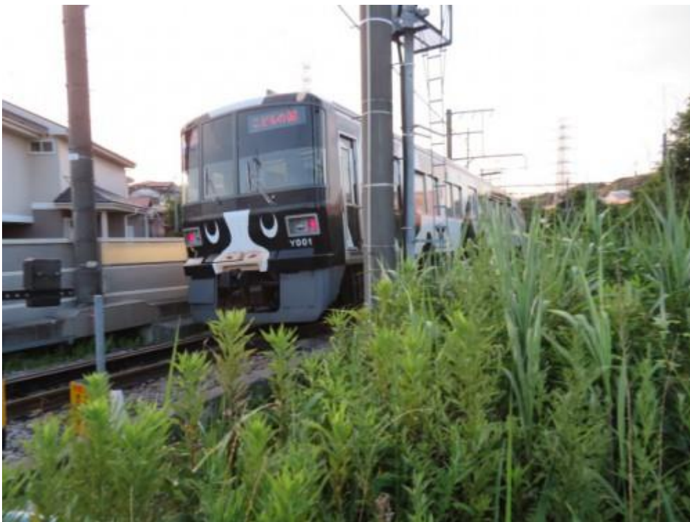
※踏切で”うし電車”と対面

⑩こどもの国線を横切り、恩田川を左手、鉄道を右手にして歩く。夕日が綺麗な田園地帯を歩く。夕方の犬の散歩をしている人達と対面する。18時33分、恩田川を渡る。この境界で通行人の方と対面し、「向うに見える急な坂道を上った先を進行すれば、長津田駅に行けるかどうか」を確認する。「行けます」と回答があり、ホットする。坂を上り、暫く歩くと、18時38分、幹線道路に合流する。この幹線道路を歩いた先に長津田駅（18時47分）があった。