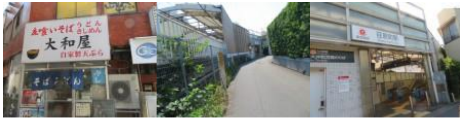
※立ち食い蕎麦屋”大和屋”、荇原町駅

③13時44分、大井町線の右側を歩く。荇原町駅には13時54分到着する。暫く歩いた先で大井町線下を潜り、鉄道の左側となる。池上線の旗の台1号踏切を横切る。踏切を渡ると、旗の台駅（14時7分）があった。14時13分、伏見稲荷神社前で本日の安全を祈願する。幹線道路を淡々と歩いた先に北千束駅（14時26分）があった。